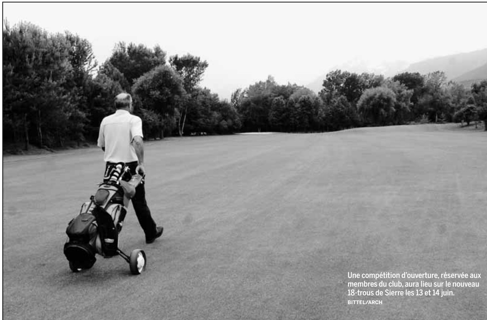
Une compétition d'ouverture, réservée aux membres du club, aura lieu sur le nouveau 18-trous de Sierre les 13 et 14 juin.