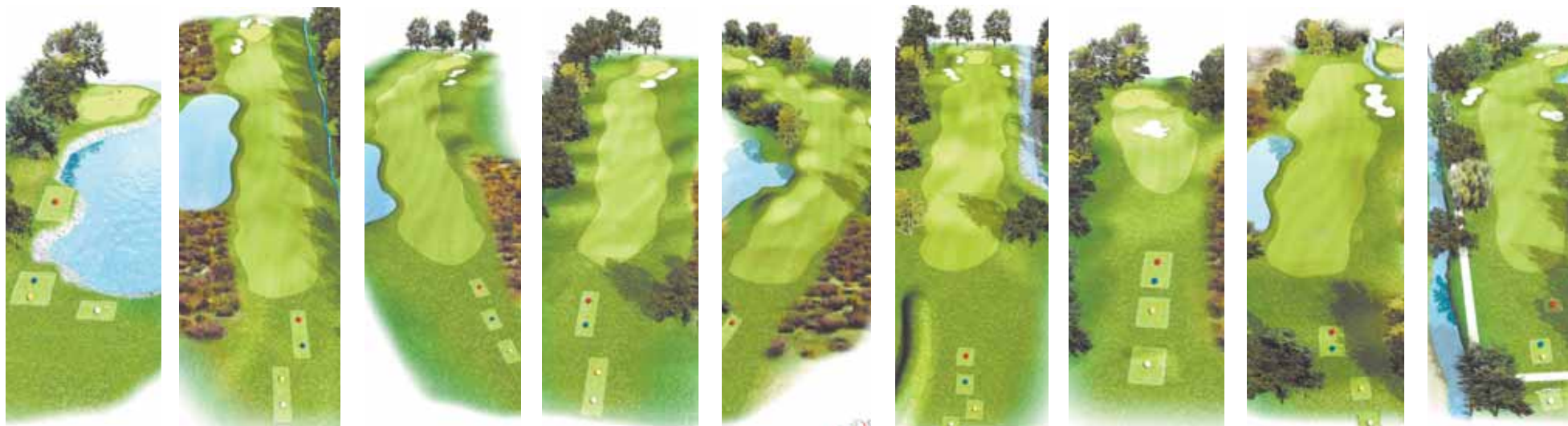
TROU 10 Par 3 126 m | TROU 11 Par 4 387 m | TROU 12 Par 4 418 m | TROU 13 Par 4 317 m | TROU 14 Par 5 431 m | TROU 15 Par 5 507 m | TROU 16 Par 3 175 m | TROU 17 Par 4 247 m | TROU 18 (ancien 9) Par 4 328 m

► Le trou 15 est un par 5 de 507 m, ce qui en fait un des plus longs de Suisse.