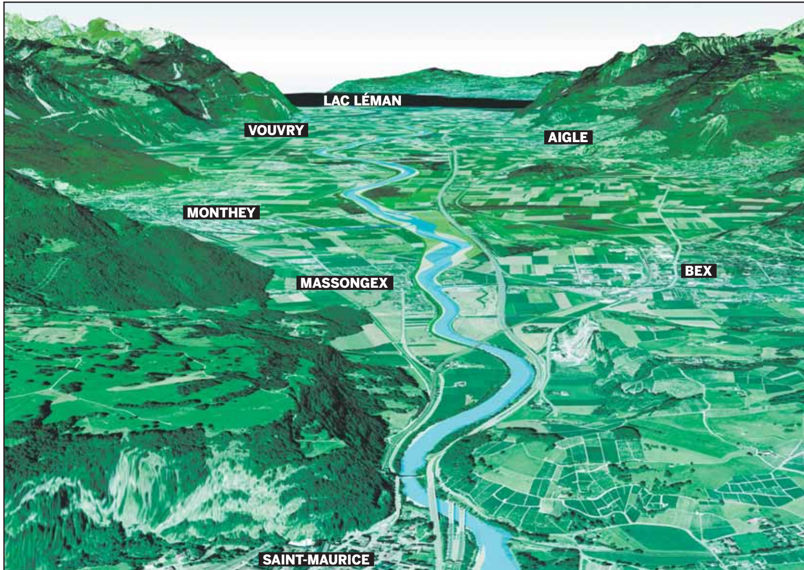
Le Rhône tel qu'il devrait se présenter en aval de Saint-Maurice d'ici à 2040, à la fin de sa troisième correction.

sur les surfaces agricoles et confirment le principe de l'élargissement du fleuve.