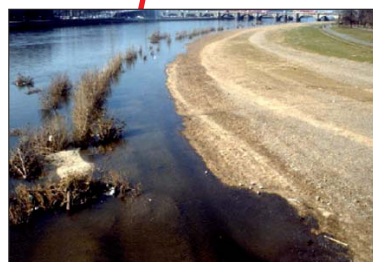
Grève sur l'Elbe.