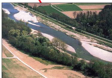
Bancs de sable.