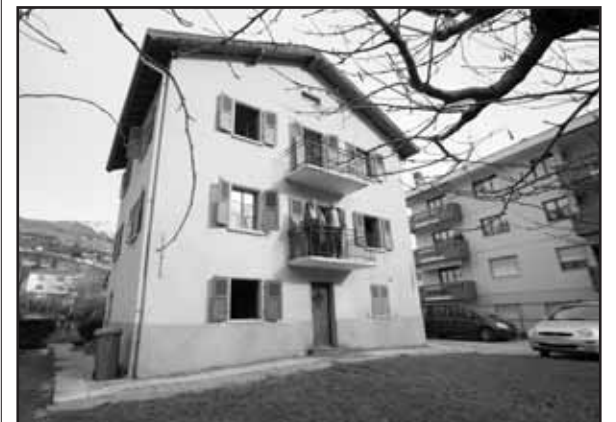
La Maison du Cœur est installée au milieu d'un jardin. Une salle pourrait être construite au rez-de-chaussée.